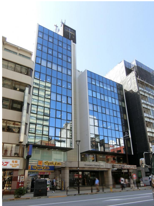
Das Ochanomizu Christian Center