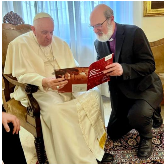
Bischof Thomas Schirmmacher im Gespräch mit Papst Franziskus über die neue WEA-Broschüre, als er den Papst besuchte, als dieser ein Jahrzehnt im Amt war.

Bischof Thomas, ist dies der Beginn oder ein Zeichen einer großen evangelikalen Bewegung in Richtung der RKK?